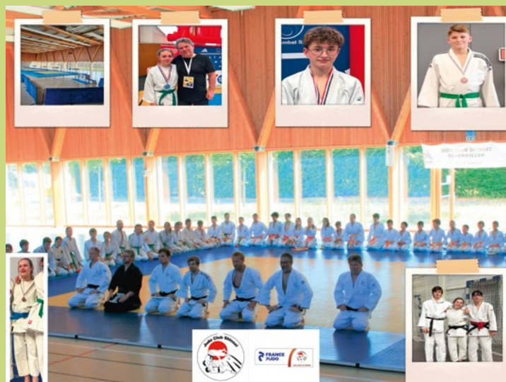
Hall of fame

ou https://www.facebook.com/judo.jujitsu.scherwiller