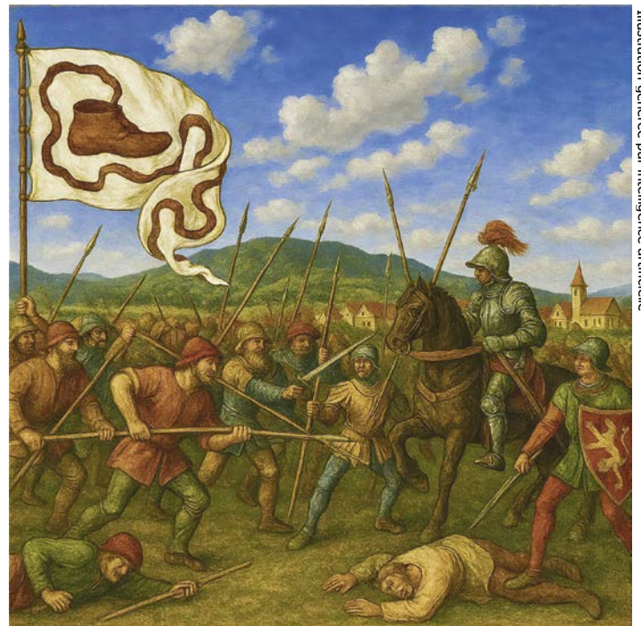
Illustration générée par intelligence artificielle

Après le massacre de milliers de paysans à Lupstein et à Saverne, les 16 et 17 mai, le duc et son armée quittent Dachstein le samedi, 20 mai, dès minuit, en direction de Saint-Hippolyte qui lui appartient et dans l'intention de passer par le Val de Lièpvre. Arrivés à hauteur de Stotzheim, vers 4 heures de l'après-midi, les mercenaires observent ici ou là des nuages de poussière. Il s'agit de bandes paysannes se dirigeant vers Scherwiller et Châtenois. On sait maintenant qu'il va falloir se battre.