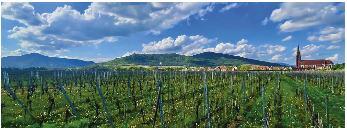
Le Krefzen désormais pacifique

Pendant ce temps, les bandes paysannes de Basse et Haute Alsace continuent à se regrouper au lieu-dit « Krefzen », sur des prés le long du Giessen, entre Scherwiller et Châtenois. L'endroit est au large, à l'entrée