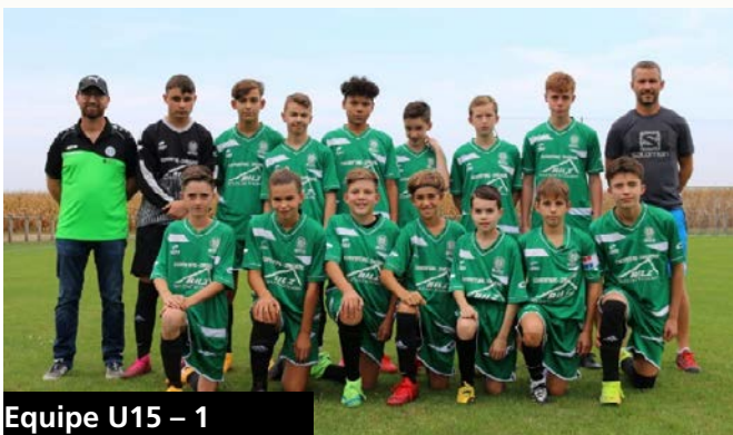
Equipe U15 – 1