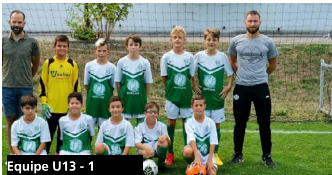
Equipe U13 - 1