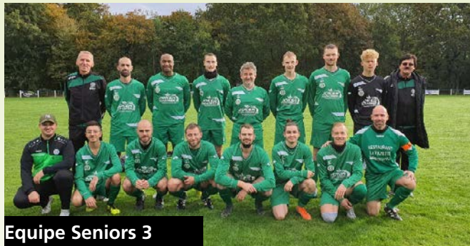
Equipe Seniors 3