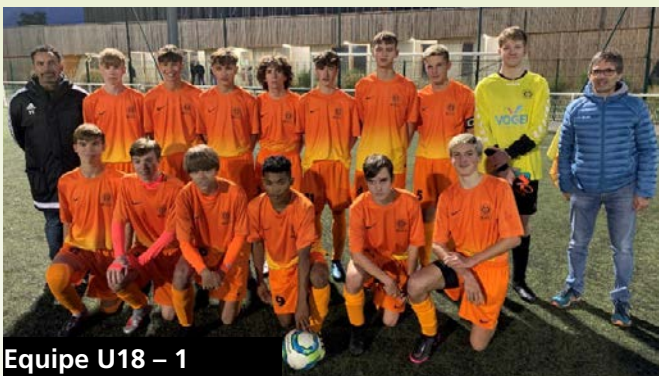
Equipe U18 – 1