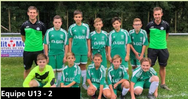
Equipe U13 - 2