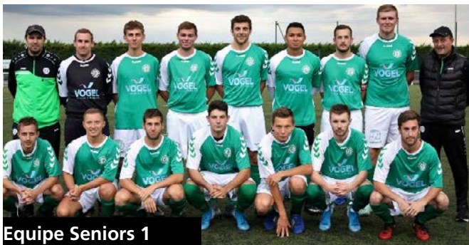
Equipe Seniors 1