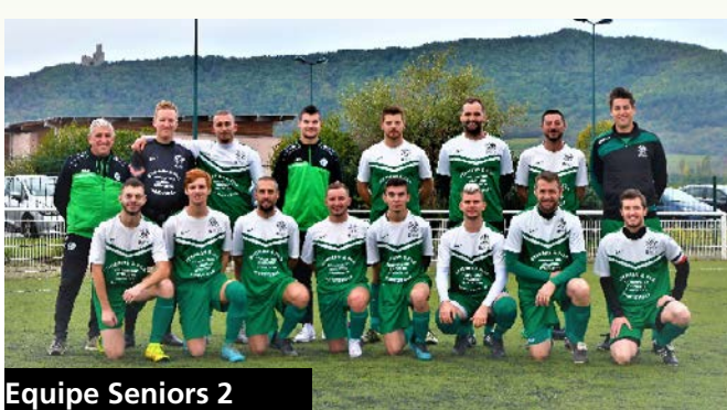
Equipe Seniors 2