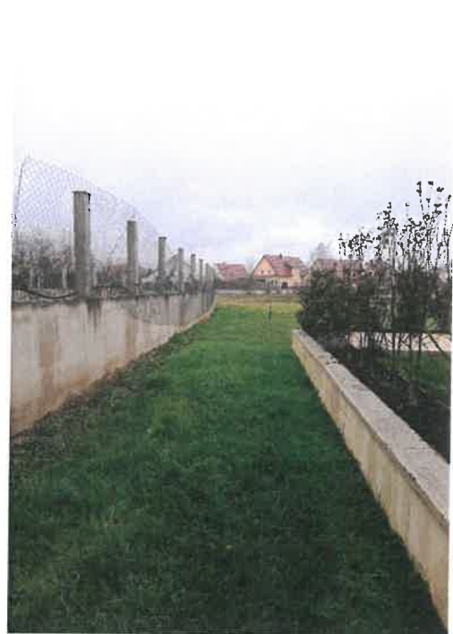
Vue vers le Nord

Ensuite, vers le Nord, son tracé se perd. La barre transversale au Nord se termine en cul de sac contre des propriétés privées.