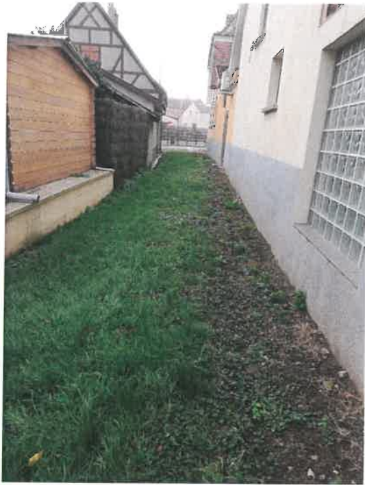
Vue vers le Sud