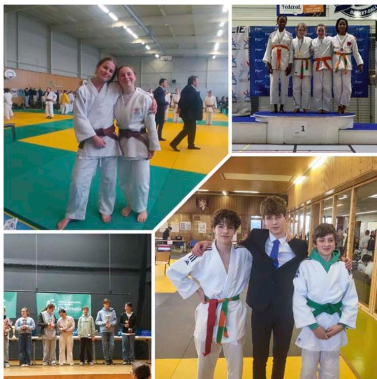
Les succès de nos jeunes compétiteurs

ou https://www.facebook.com/judo.jujitsu.scherwiller