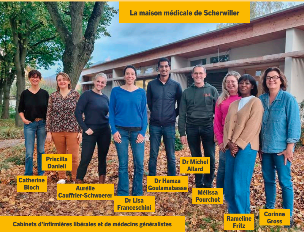
Cabinets d'infirmières libérales et de médecins généralistes