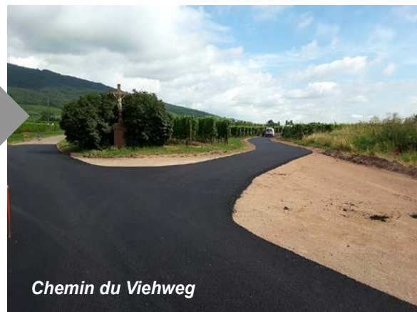
Chemin du Viehweg