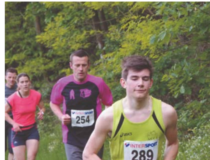
La terrible montée du « gaz »